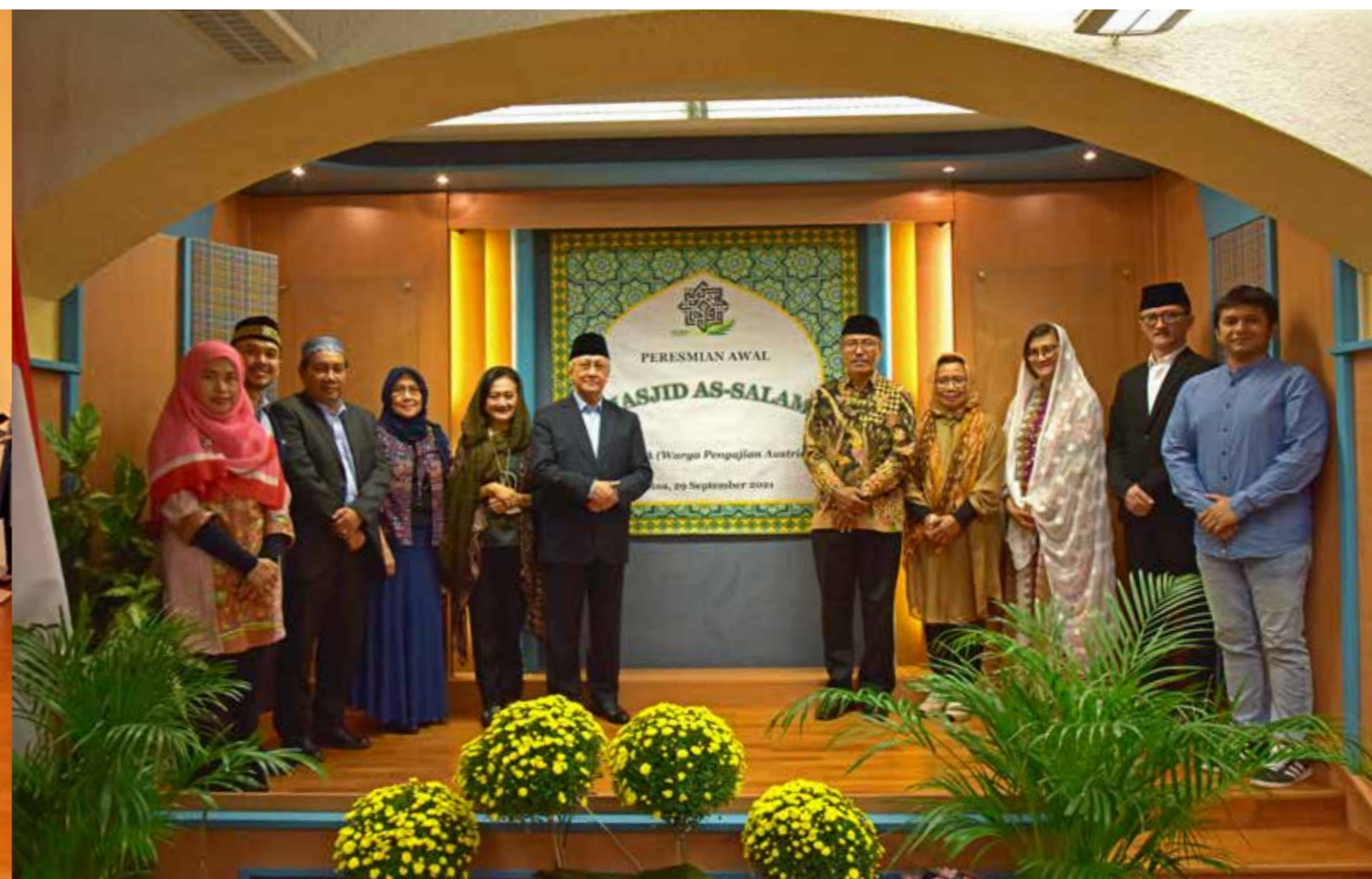
Peresmian Masjid As-Salam bagi umat muslim yang tergabung dalam Warga Pengajian Austria (Wapena) dipimpin oleh Duta Besar RI untuk Austria Darmansjah Djumala pada 29 September 2021.