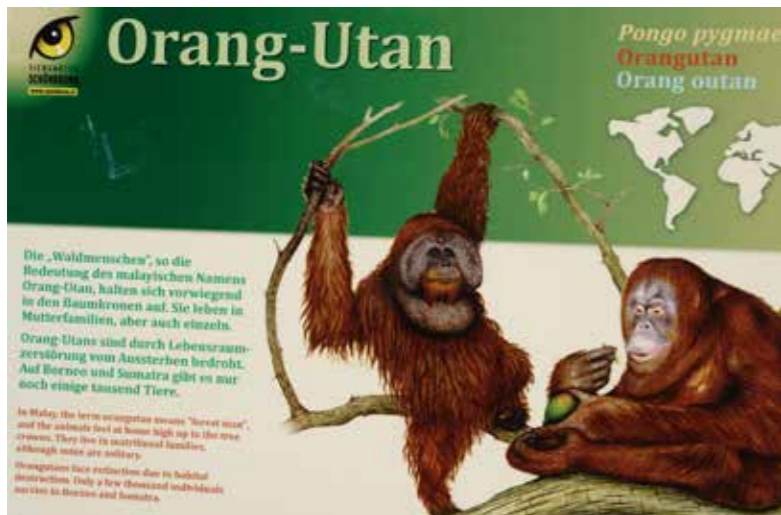
Peresmian kandang baru bagi orang utan di Kebun Binatang Schönbrunn pada tanggal 20 Mei 2009.