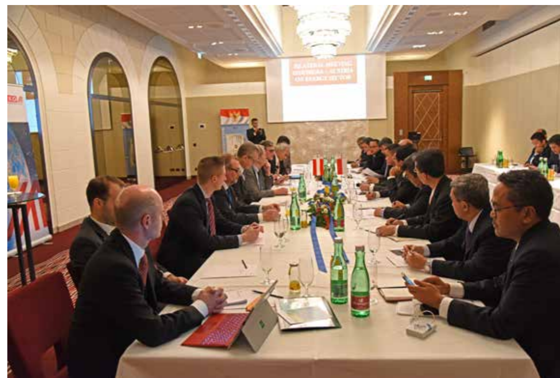
Pertemuan Bilateral Indonesia - Austria di Sektor Energi dilaksanakan di Wina, Austria, pada 29 November 2016.

Im Jahr 2014 unterzeichneten der indonesische Minister für ESDM Jero Wacik und die österreichische Ministerin für Transport, Innovation und Technologie Doris Bures das Abkommen zur Zusammenarbeit in der Infrastrukturtechnologie zur Gewinnung von Wasserkraftenergie (PLTA). Dieses Abkommen basiert auf der beidseitigen Bedeutung der weiteren Zusammenarbeit bei erneuerbaren Energien, der Steigerung von Investitionen in der Technologie der Infrastruktur, von technologischem Transfer und Wissensdialog, dem Erfahrungsaustausch bei der Implementierung der PLTA-Technologie sowie der wissenschaftlichen und technischen Zusammenarbeit. Die beiden Länder stimmen darin überein, einen vitalen Beitrag erneuerbarer Energien zum zukünftigen Wirtschaftswachstum zu leisten. Das österreichische Unternehmen Andritz Hydro ist bereits seit 10 Jahren auf diesem Gebiet tätig. Dieses Unternehmen stellt technische