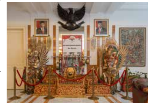
unten Bilder des Präsidenten und Vizepräsidenten Indonesiens darunter Galerie der vergangenen Botschafter Indonesiens in Österreich

Seither wird in der Gustav-Tschermak-Gasse 5-7 intensiv am Dialog zwischen Indonesien und Österreich, an der Vermittlung von indonesischer Kultur und Sprache und an den multilateralen Beziehungen mit den internationalen Organisationen in Wien gearbeitet.