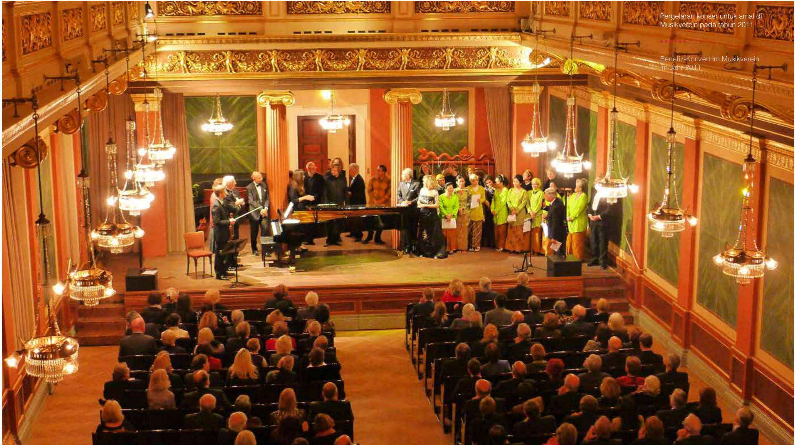
Pergelaran konser untuk amal di Musikverein pada tahun 2011