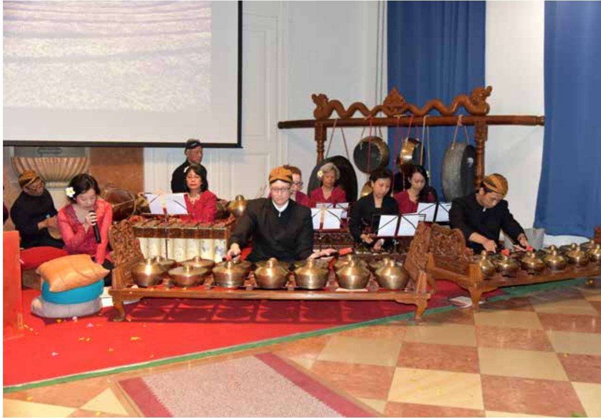
Penampilan gamelan dalam pentas seni tradisional bertajuk "An Ancient Cultural Heritage of Indonesia" pada bulan April 2019.