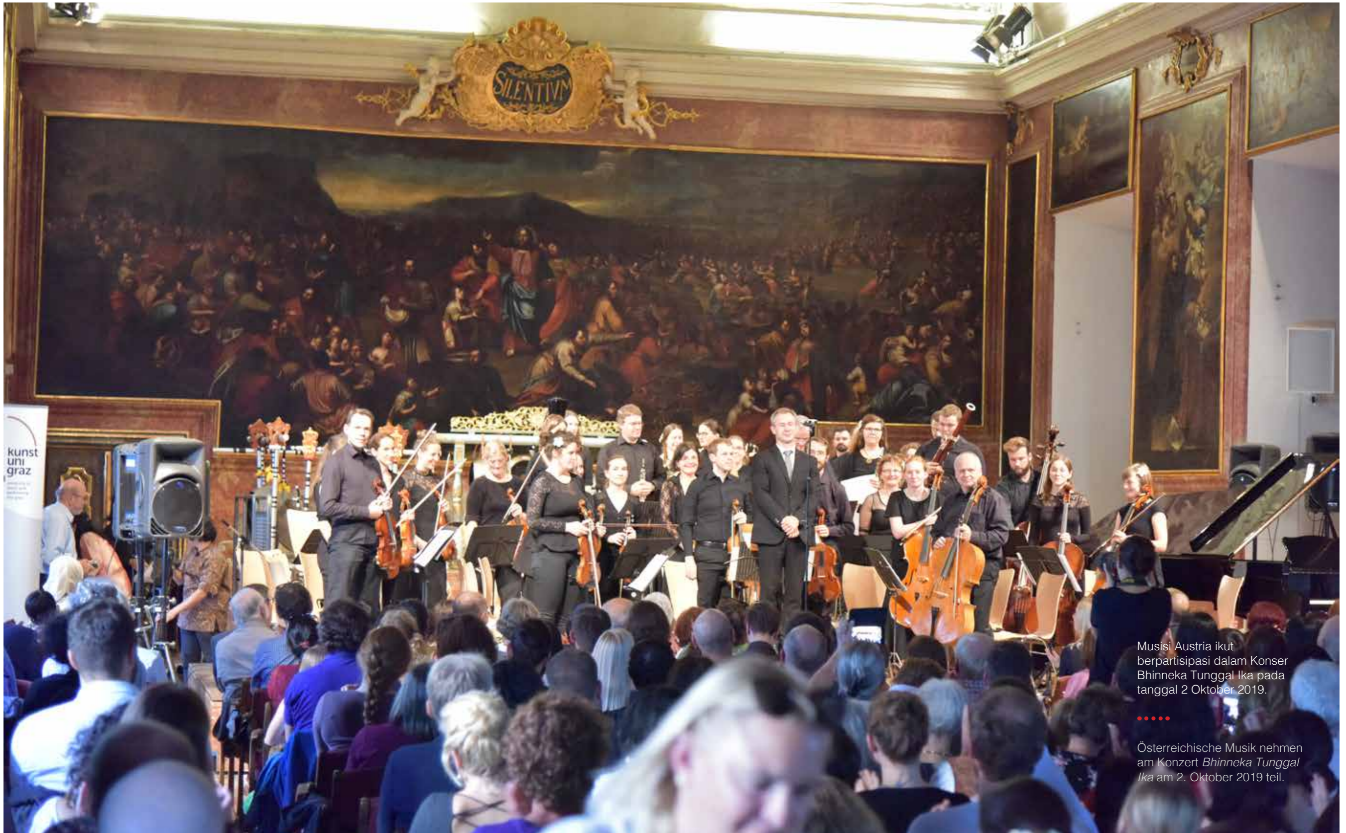
Musisi Austria ikut berpartisipasi dalam Konser Bhinneka Tunggal Ika pada tanggal 2 Oktober 2019.