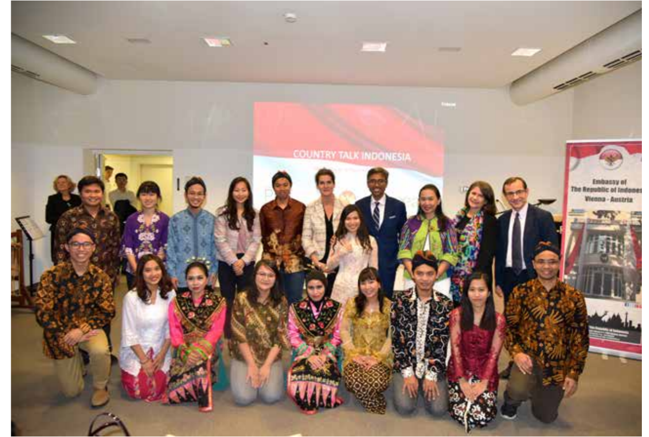
Para penerima beasiswa pendidikan dalam OeAD Country Talk Indonesia pada bulan November 2019.

Gamelan-Auftritt im Rahmen der Aufführung traditioneller Künste mit dem Titel "An Ancient Cultural Heritage of Indonesia" im April 2019.