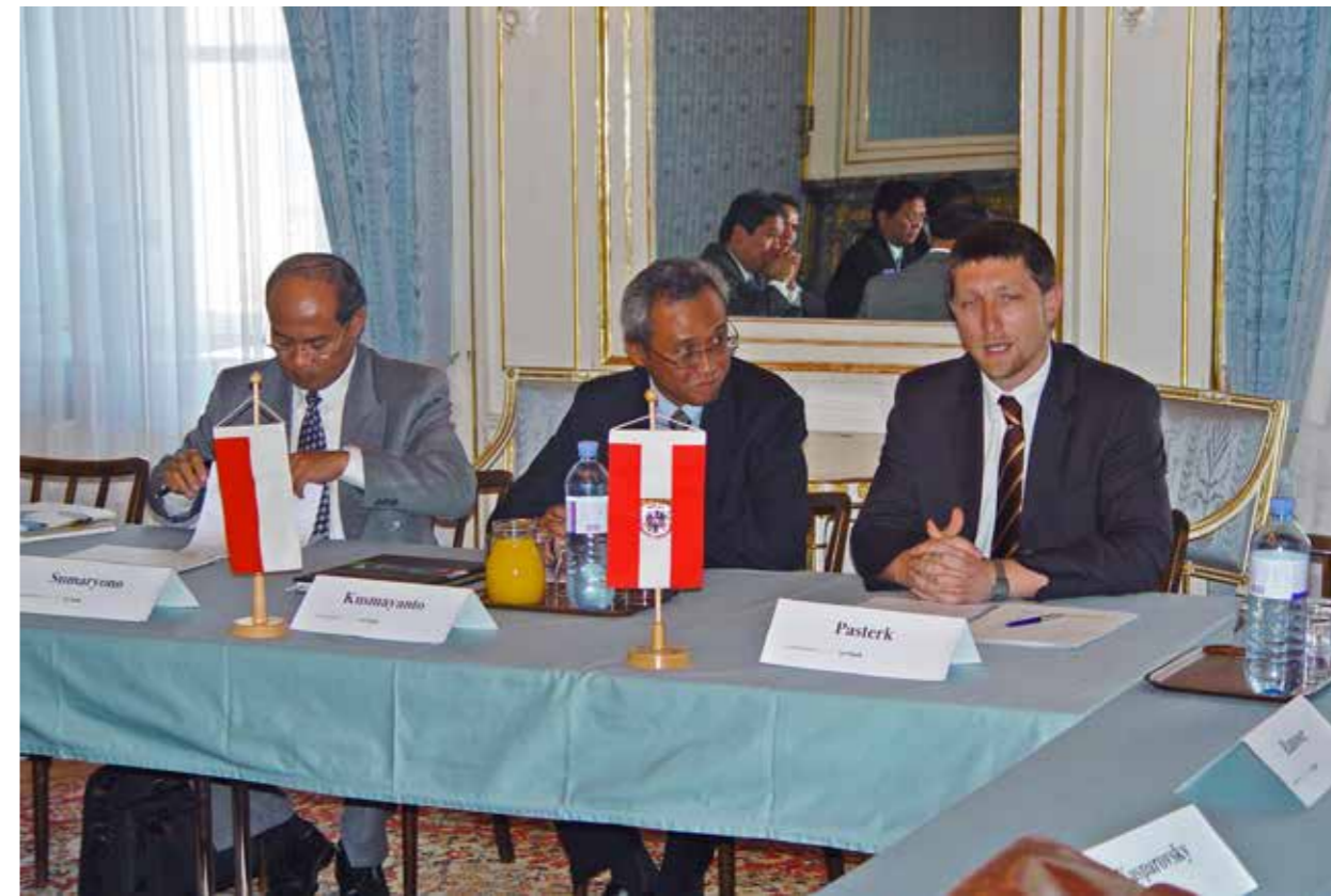
Menteri Negara Riset dan Teknologi Indonesia Kusmayanto Kadiman pada salah satu kegiatan dalam kunjungan kerja tanggal 20 Juni 2005.

Die indonesische Gesundheitsministerin Siti Fadilah Supari und die österreichische Gesundheitsministerin Ursula Haubner tauschen bei einem Treffen am 20. Mai 2005 Souvenirs aus.