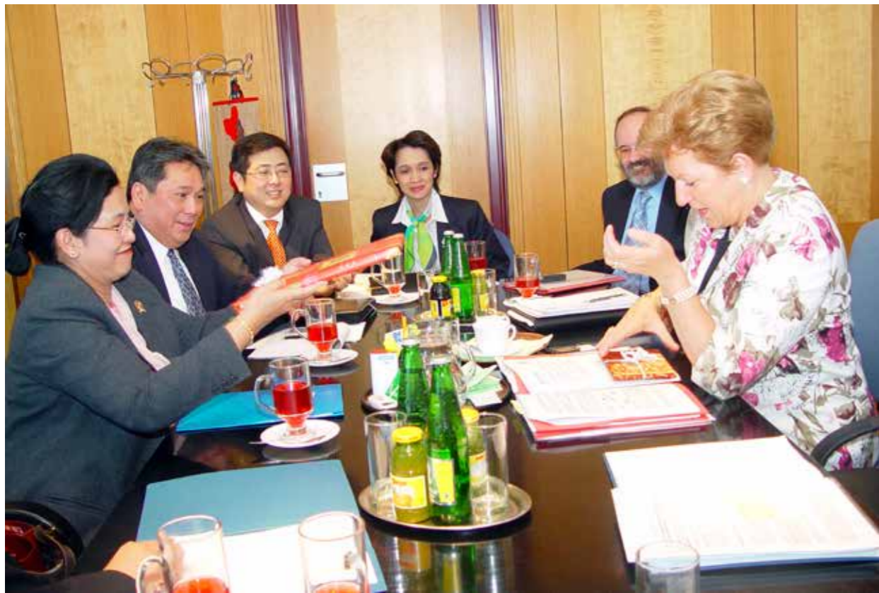
Menteri Kesehatan Indonesia Siti Fadilah Supari dan Menteri Kesehatan Austria Ursula Haubner bertukar cendera mata pada pertemuan tanggal 20 Mei 2005.