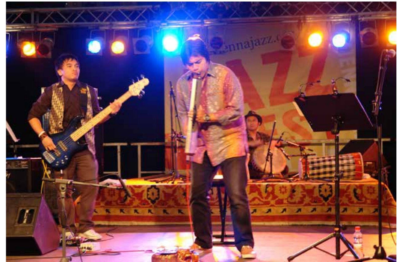
Musisi Indonesia Dwiki Dharmawan tampil memukau di ajang Jazz Festival Wien pada Juli 2010.