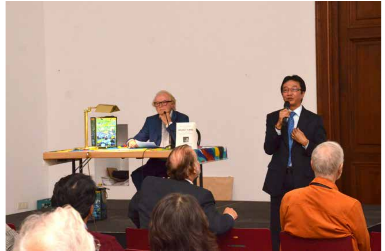
Presentasi Buku tentang Bali oleh Helmut Kand di Weltmuseum, 24 September 2014

Vorstellung von Titus Lebers Dokumentar film Borobudur - Path to Enlightenment, 11. März 2013