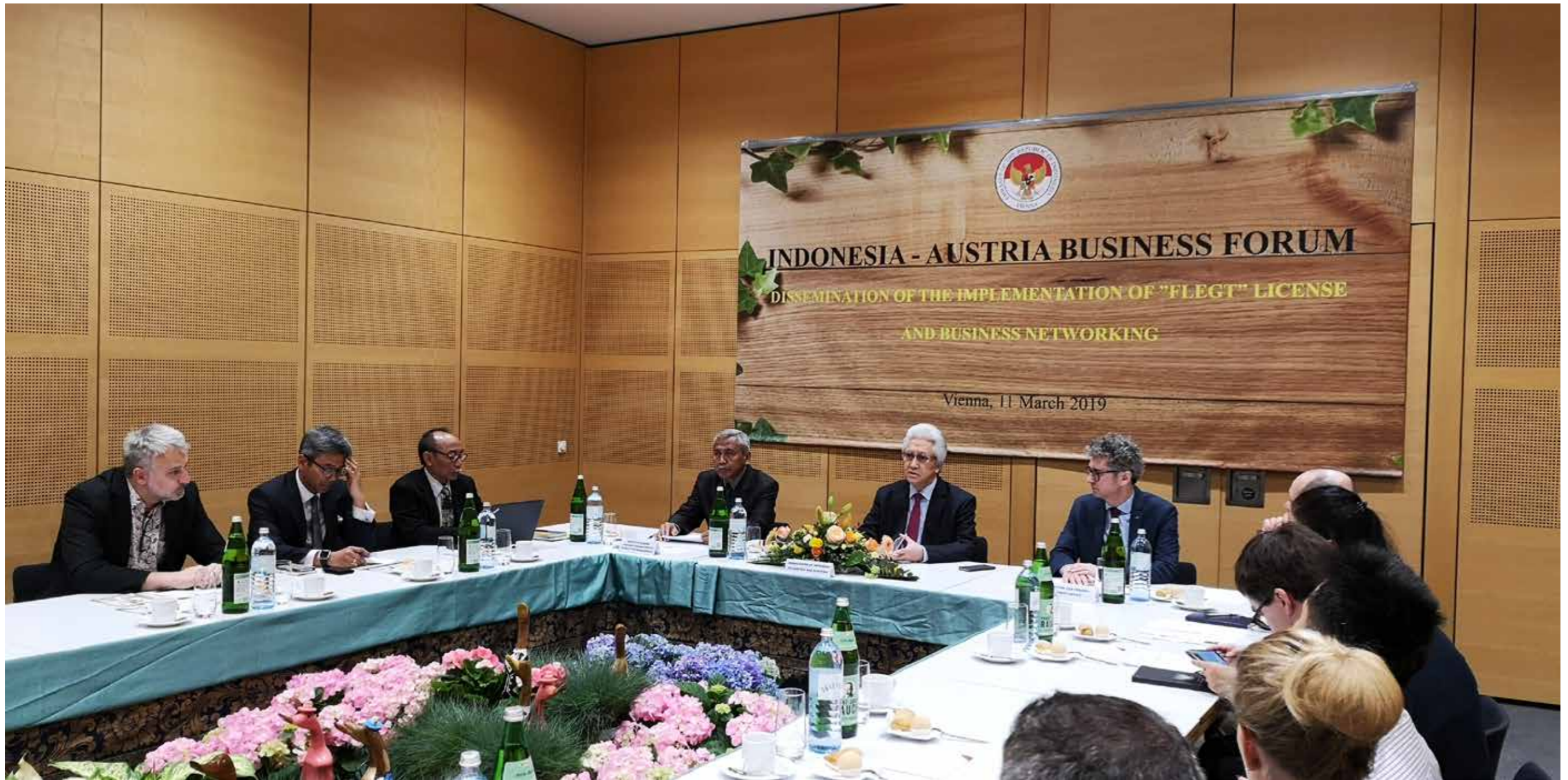
Penguatan kerja sama ekonomi dalam Indonesia-Austria Business Forum pada tanggal 11 Maret 2019.