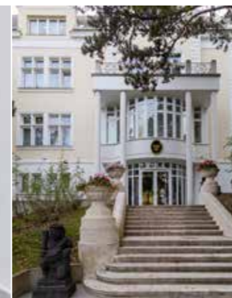
Der Eingangsbereich der Botschaft

A ufzeichnungen aus dem Jahr 1683 verraten, dass das Gelände zur Zeit der Zweiten Türkenbelagerung Teil der Befestigungsanlage der Osmanen ist, die aber in der Entsatzschlacht bzw. der „Schlacht am Kahlenberg“ am 12. September erstürmt wird.