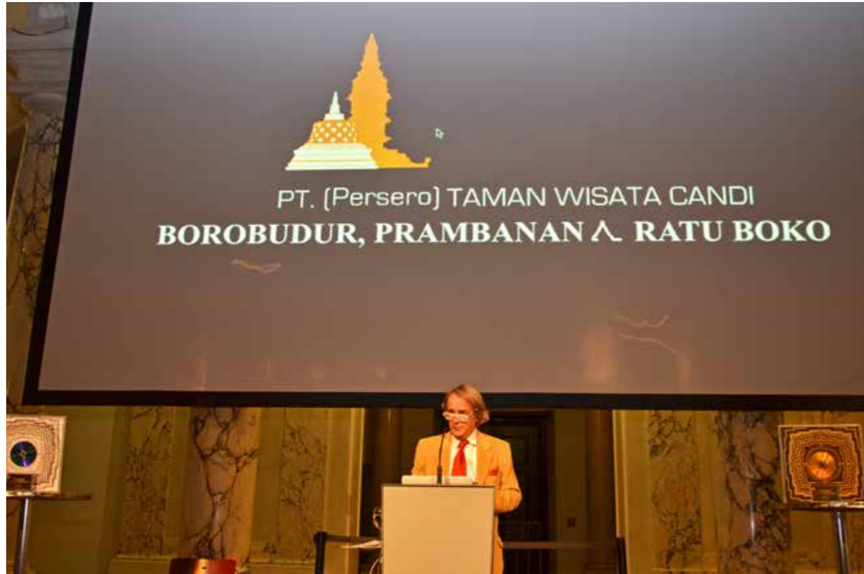
Peluncuran Dokumenter Borobudur - Path to Enlightenment karya Titus Leber, 11 Maret 2013