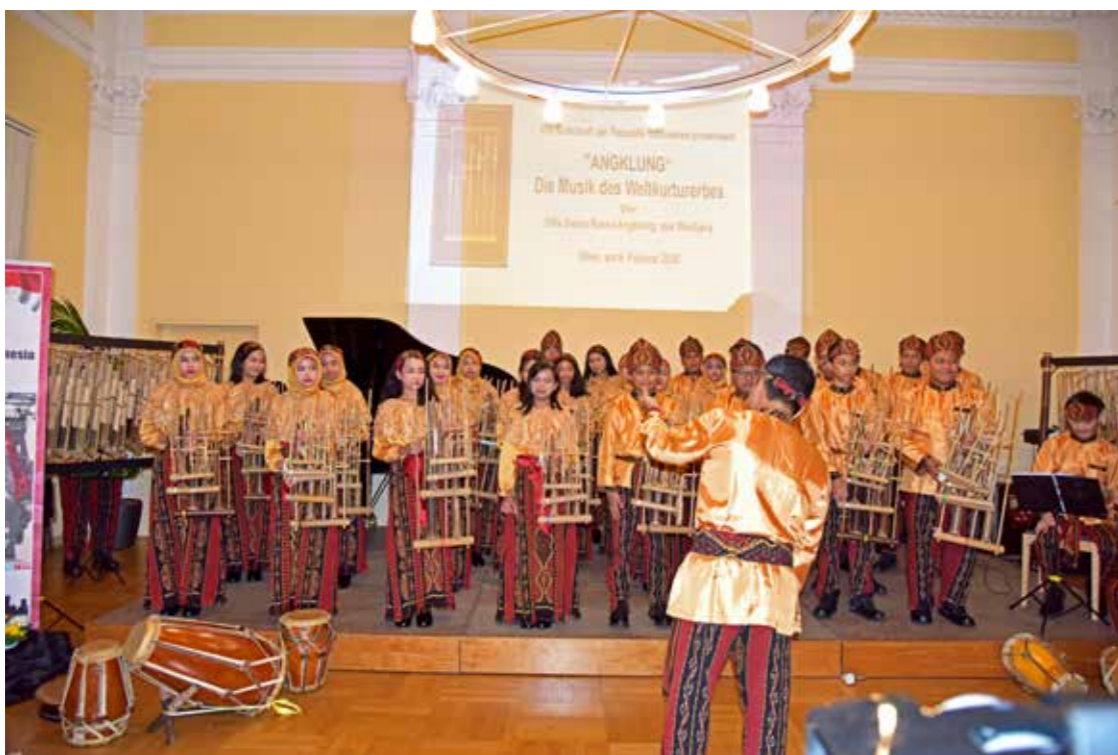
Die Musik des Weltkulturerbes - Gita Swara Nassa Angklung dari Jawa Barat, 6 Februari 2020.