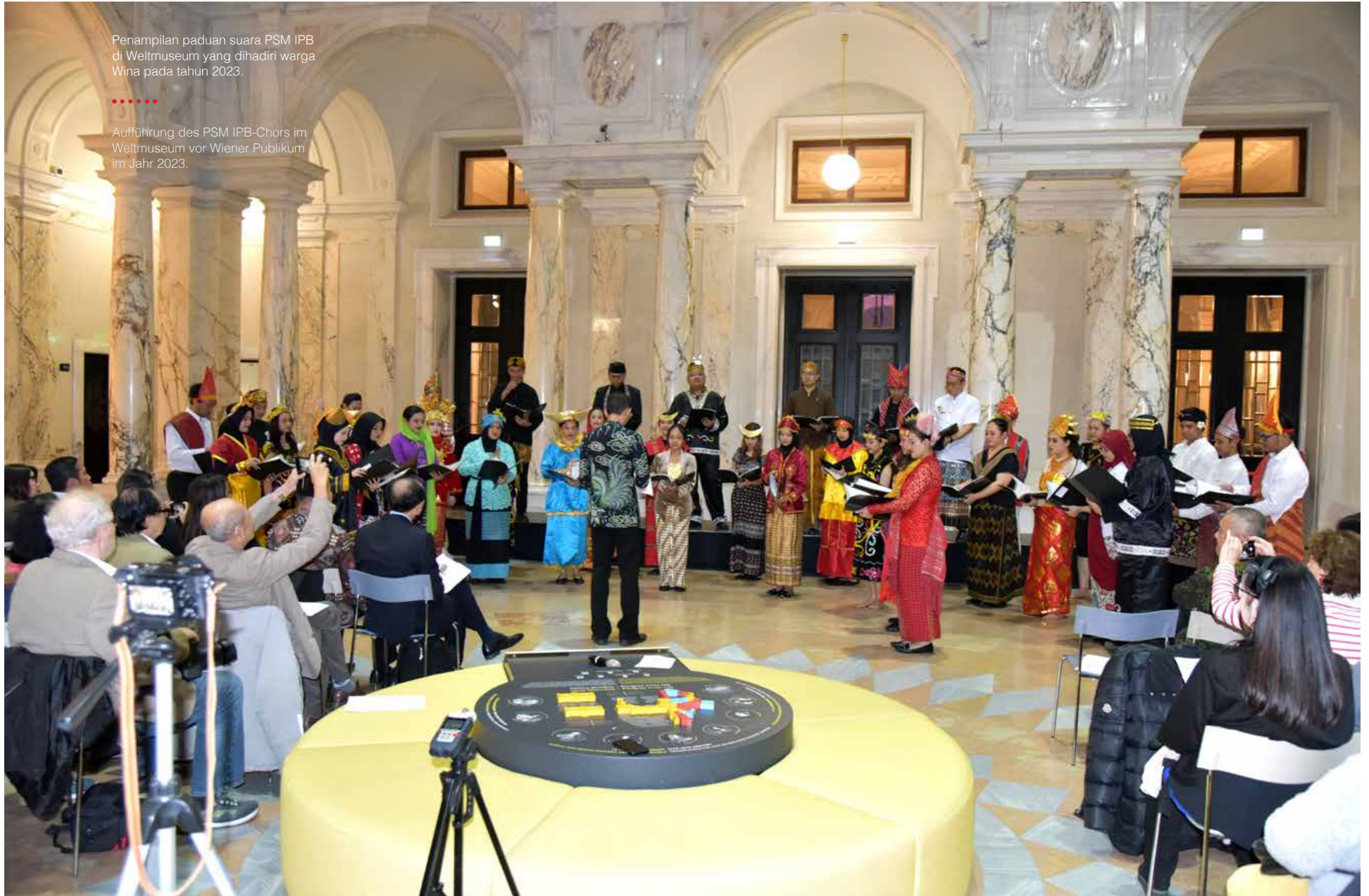
..... Aufführung des PSM IPB-Chors im Weltmuseum vor Wiener Publikum im Jahr 2023.