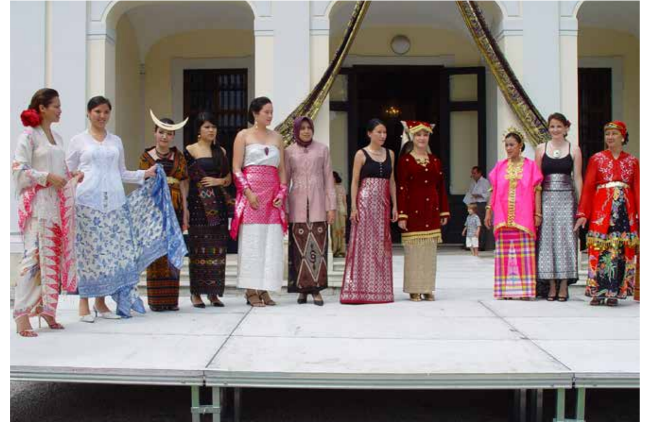
Pameran busana yang terinspirasi dari pakaian tradisional Indonesia di Sekolah Mode Hetzendorf pada tanggal 26 Juni 2008.