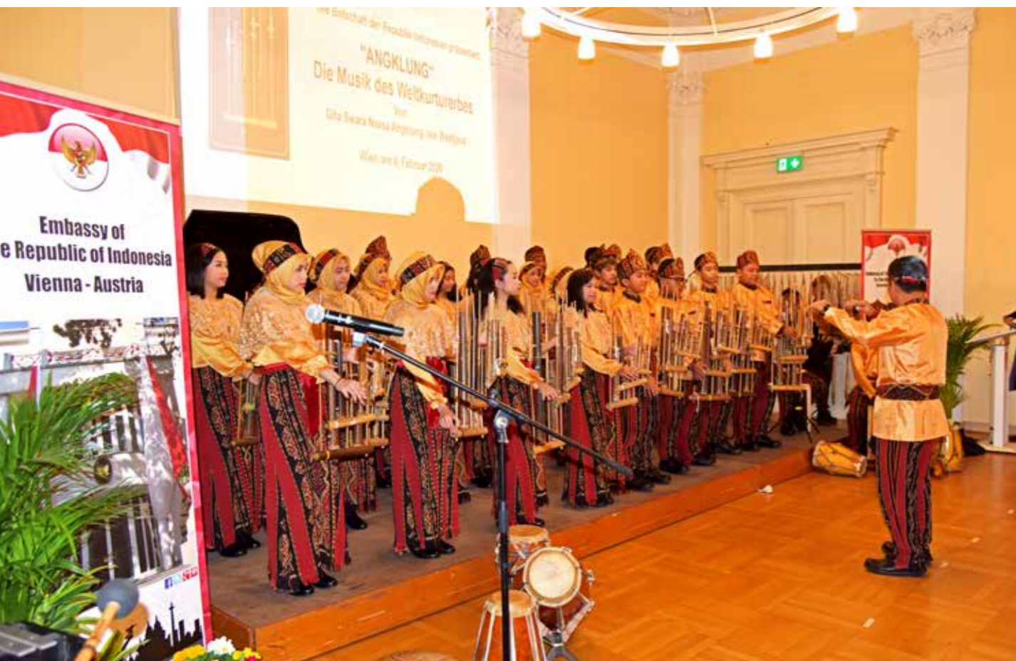
Gita Swara Nassa Angklung menggelar pertunjukan musik tradisional angklung di Wina pada 2020.