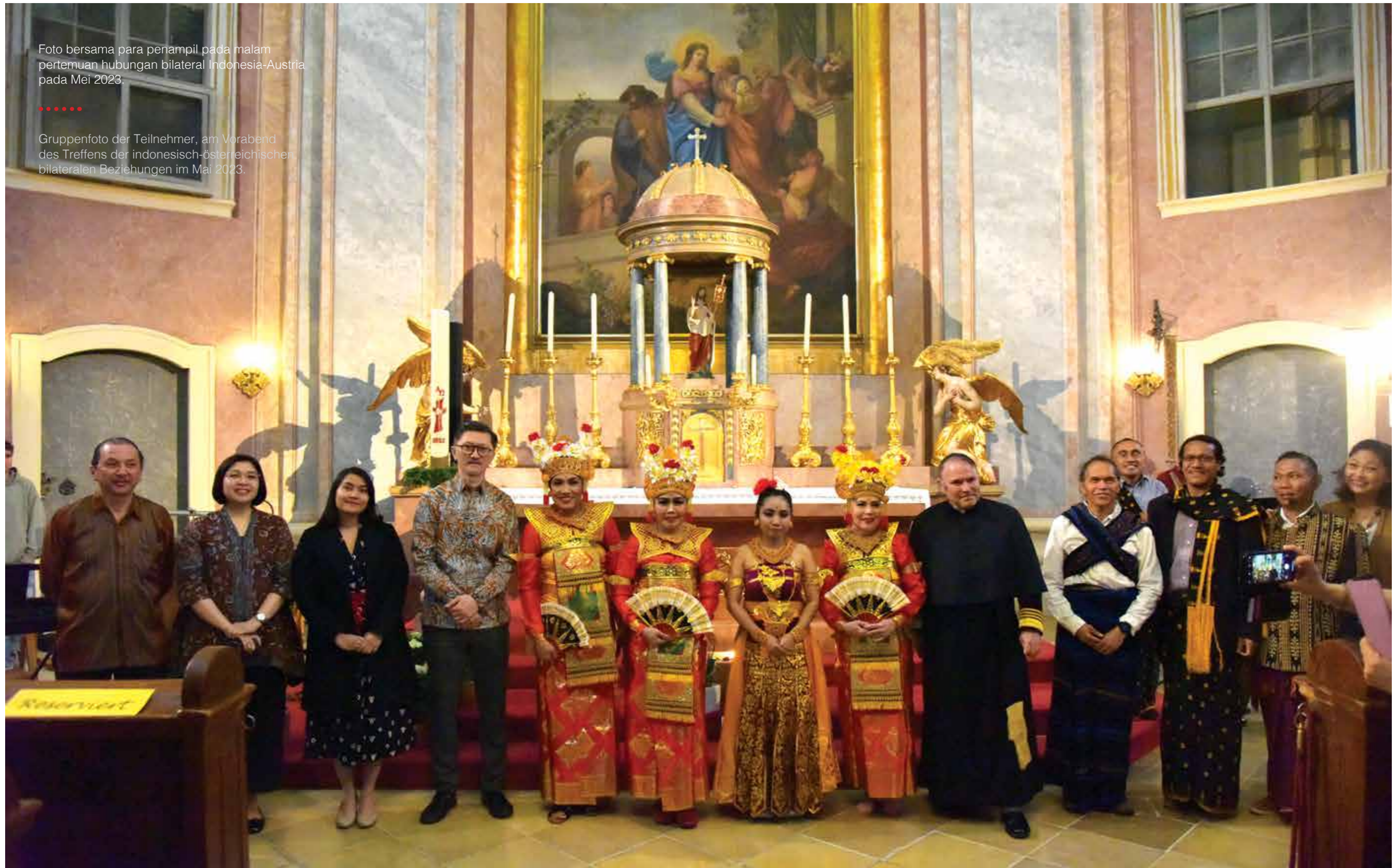
Gruppenfoto der Teilnehmer, am Vorabend des Treffens der indonesisch-österreichischen bilateralen Beziehungen im Mai 2023.