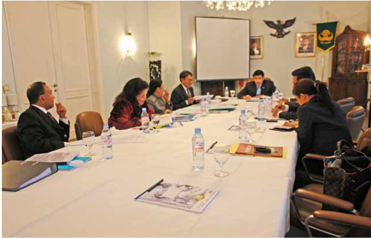
Kunjungan Menteri Luar Negeri RI Hassan Wirajuda ke Austria pada 26 dan 27 Maret 2006.