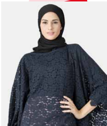
musulmans produits vêtements

La Galerie UKM collectionne les produits de haute qualité faits par les célèbres fournisseurs de l'Indonésie-les enfants de la nation" et vous présente toute sa beauté.