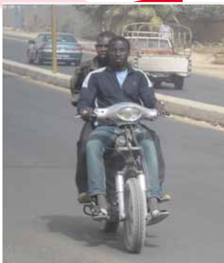
Motor 'Djakarta' à Dakar

A Dakar, Sénégal, il y a quelque chose de particulier qu'est l'existence de motos de plus en plus connues sous le nom 'Djakarta'. Pour les habitants de Dakar, ces motos font partie du décor de la circulation de tous les jours. D'après les informations recueillies auprès de certains citoyens à Dakar, le nom Djakarta est utilisé pour les moyens de transport public à deux roues au Sénégal.