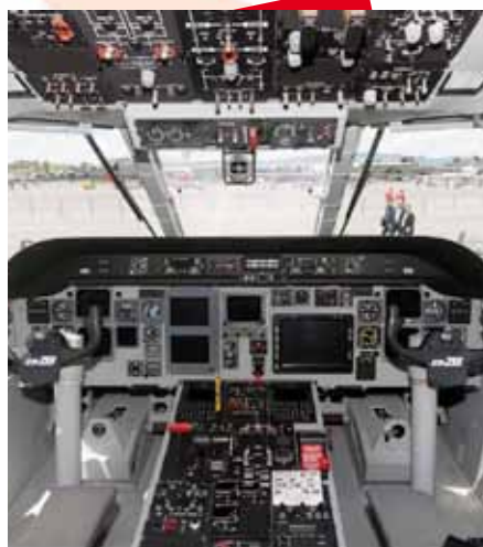
(Cockpit de l'avion CN-235)