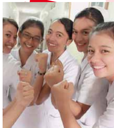
Travailleurs indonésiens dans le secteur de la santé publique