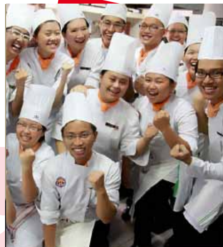
Travailleurs indonésiens dans le tourisme/Hospitalité