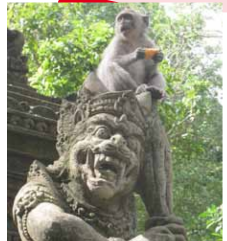
Statue distincte à Bali et un singe dans la forêt de Ubud