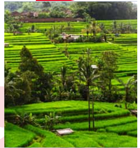
Champs de riz à Bali