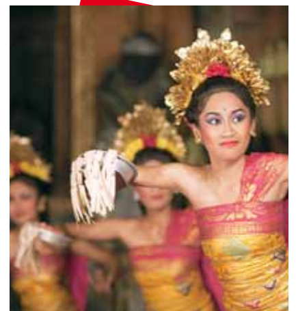
Danse Traditionelle de Bali