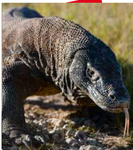
Komodo Varanus komodoensis dans son habitat naturel

Lingsar : Ici, on peut voir beaucoup de bassins de poissons sacrés à 9 Km de Mataram.