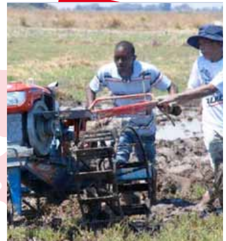
tracteur à main Quick en train d'être opéré sur le terrain agricole en Afrique

Disposant de meilleures ressources humaines soutenues par des équipements de haute technologie, CV. Karya Hidup Sentosa est prêt à faire face aux défis de l'heure, au développement mondial et à la globalisation économique. C'est le moment pour CV. Karya Hidup Sentosa d'être confiant et d'avoir la volonté de fournir un service de qualité aux clients et aux sociétés partenaires.