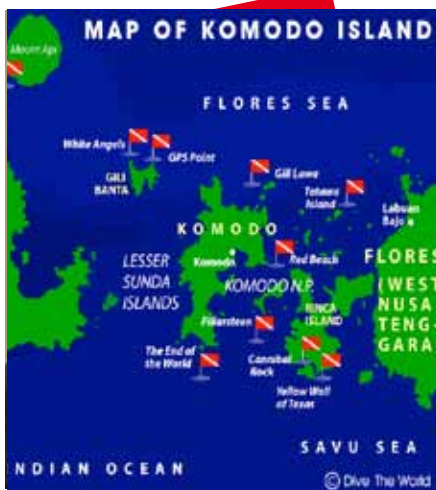
Carte de l'île des Komodos, Indonésie