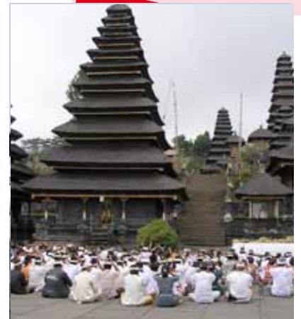
Fidèles locaux priant à Pura Besakih