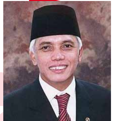
Son Excellence Ir. M. Hatta Radjasa

MINISTRE COORDINATEUR DES AFFAIRES ECONOMIQUES M. HATTA RAJASA