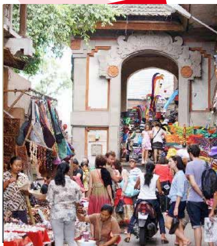
Foule de touristes au marché de Kuta