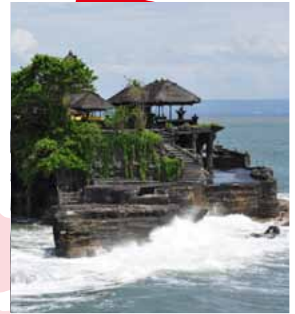
Temple Tanah Lot

Suranadi : Il y a beaucoup d'hôtels avec des installations complètes telles que des piscines avec eau tiède et des courts de tennis. Il y a aussi un des plus anciens temples hindus qui se trouvent à 17 km de Mataram, capitale de la province de East nusa Tenggara.