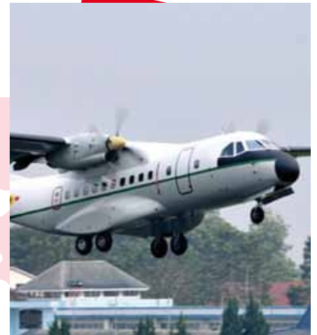
L'avion CN 235 fabriqué par PT Dirgantara Indonesia

Au début, la fabrication des avions CN-235 a été initiée pour développer une coopération entre PTDI et CASA (Airbus Militaire) en 1979. Le prototype du CN-235 est sorti en septembre 1983 and a fait son premier décollage en décembre 1983. En 1986, le CN-235 est entré sur le marché pour des fins civiles et militaires. Jusqu'à présent, il y près de 300 CN-235 appareils opérant dans beaucoup de pays. La liste suivante est celle des institutions qui font la commande directement des avions de type CN-235 auprès de PT DI :